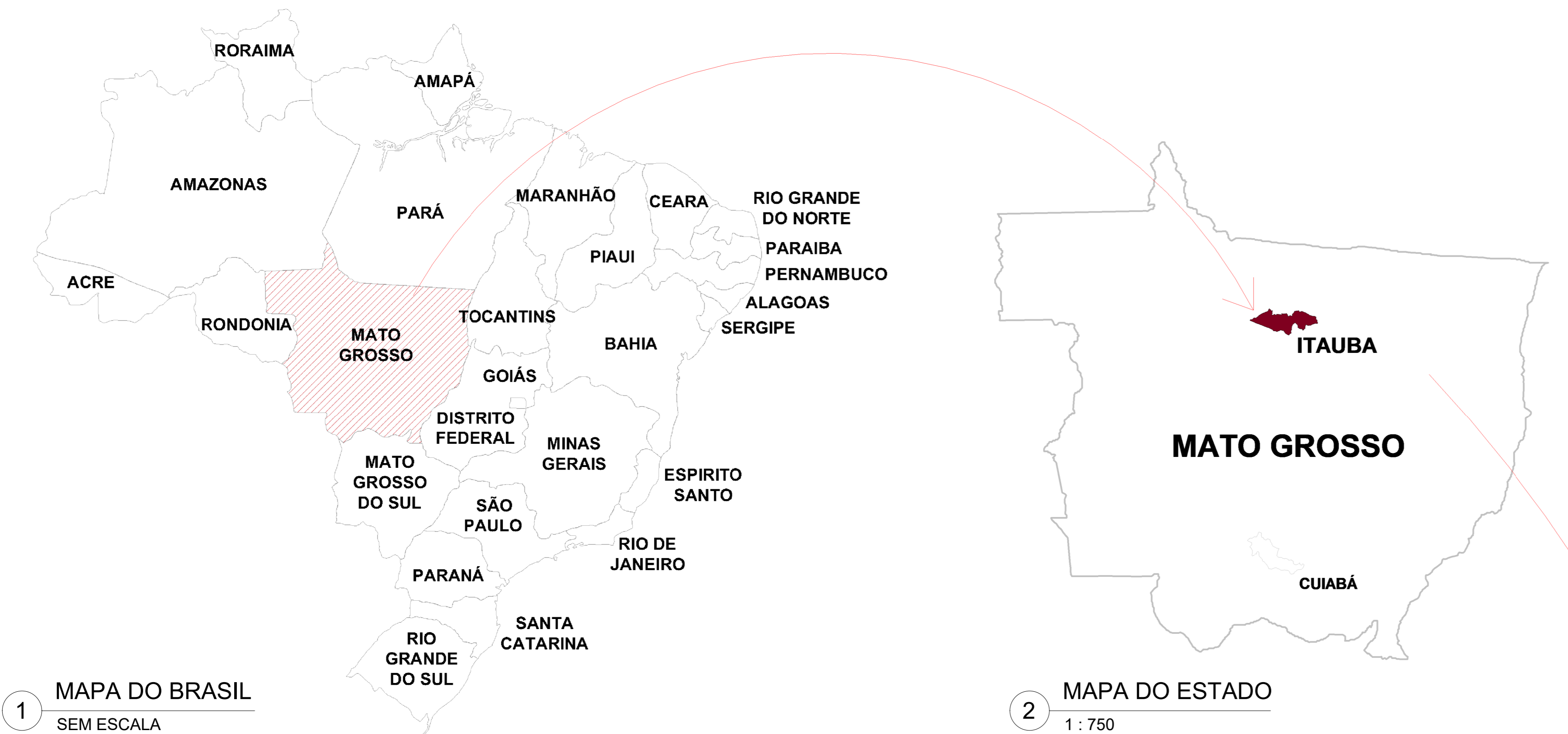
1 MAPA DO BRASIL SEM ESCALA